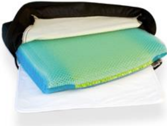
StimuLITE Polyurethan Matte Für atmungsaktive Polsterung 60 x 60 cm