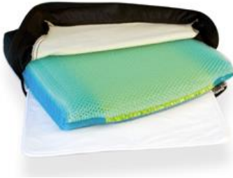
StimuLITE Polyurethan Matte Für atmungsaktive Polsterung 60 x 60 cm